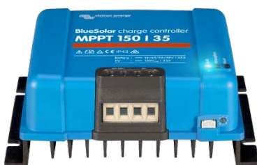
Contrôleur de charge solaire MPPT 150/35